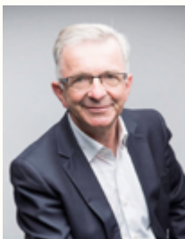
FRANÇOIS BONNEAU Président de la Région Centre-Val de Loire