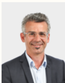
EMMANUEL DENIS Maire de Tours